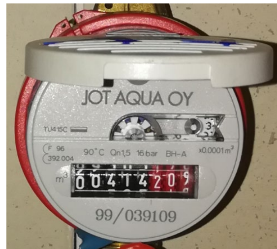
Esimerkki 4: Mittarin rullalaskurissa näkyy täysien kuutioiden (mustalla) lisäksi kolme desimaalia (punaisella), joita ei ilmoiteta. Ilmoitettava lukema on 414.