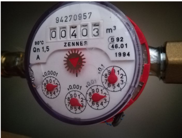
Esimerkki 1: Mittarin rullalaskurissa näkyy ainoastaan täydet kuutiot (m³). Ilmoitettava lukema on 403.