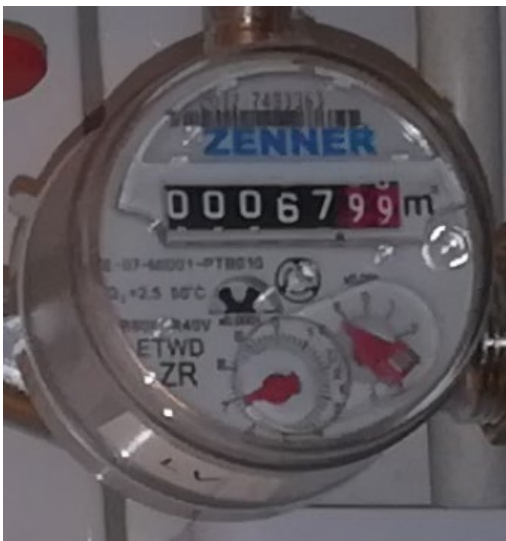
Esimerkki 3: Mittarin rullalaskurissa näkyy täysien kuutioiden (mustalla) lisäksi kaksi desimaalia (punaisella), joita ei ilmoiteta. Ilmoitettava lukema on 67.