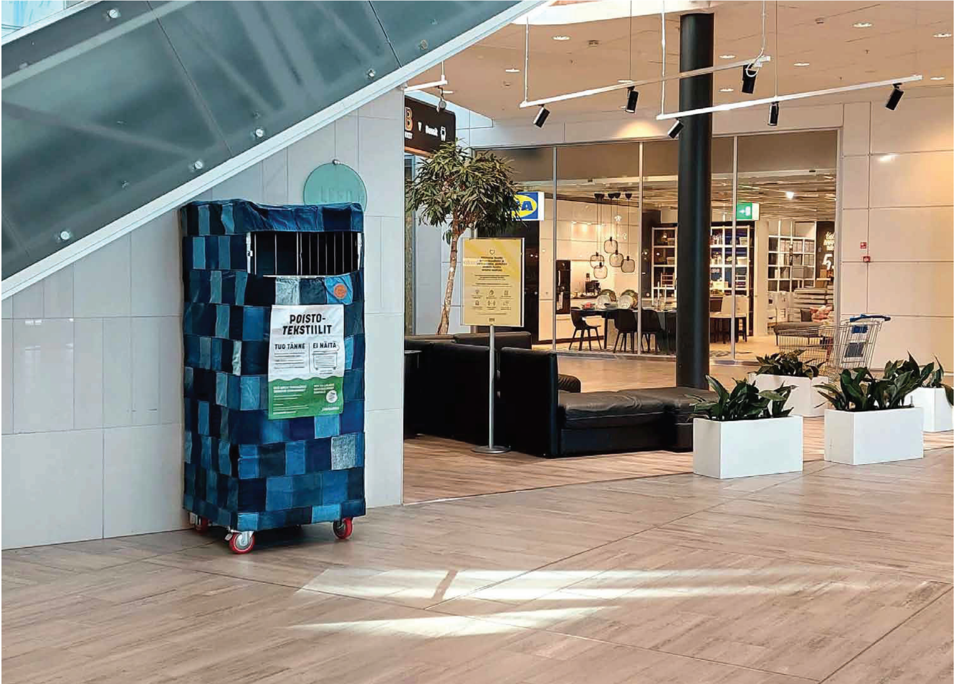
Farkkukankaiset poistotekstiilin keräyspisteet sijaitsevat kuudessa kauppakeskuksessa Kuopiossa.

Jätekkukko on aloittanut poistotekstiilin keräyskokeilun, joka jatkuu elokuun loppuun saakka. Kokeilun avulla valmistautaan ensi vuonna alkavaan poistotekstiilin keräykseen.